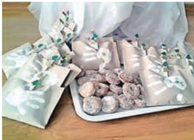
Otroci so v vrtcu spekli piškote, jih zapakirali v darilne vrečke, ki so jih sami izdelali, ter jih podarili staršem kot voščilo ob novem letu.

MISA s.p. Strahinj 74 4202 NAKLO RAČUNOVODSKE STORITVE