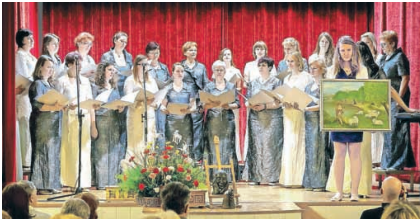
Narodne pesmi so zaživele: ženski pevski zbor Dupljanke

so jih pripravili člani društva. Prireditev je tako povezala vsa tri kulturna društva v občini, segla pa je čez občinske meje in tako uresničila lani zastavljen cilj.