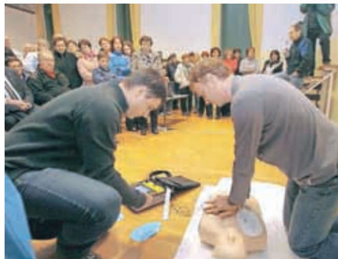
Prikaz oživljanja s pomočjo defibrilatorja. Defibrilator je nameščen na gasilskem domu v Dupljah.