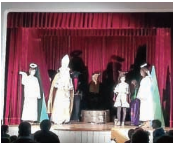
Sveti Miklavž je otroke obiskal v Podbrezjah, Dupljah in v Naklem.