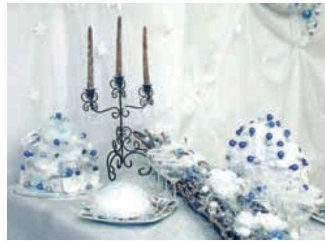
Domišljjski božič v ledeni dobi, dijaki 3.e