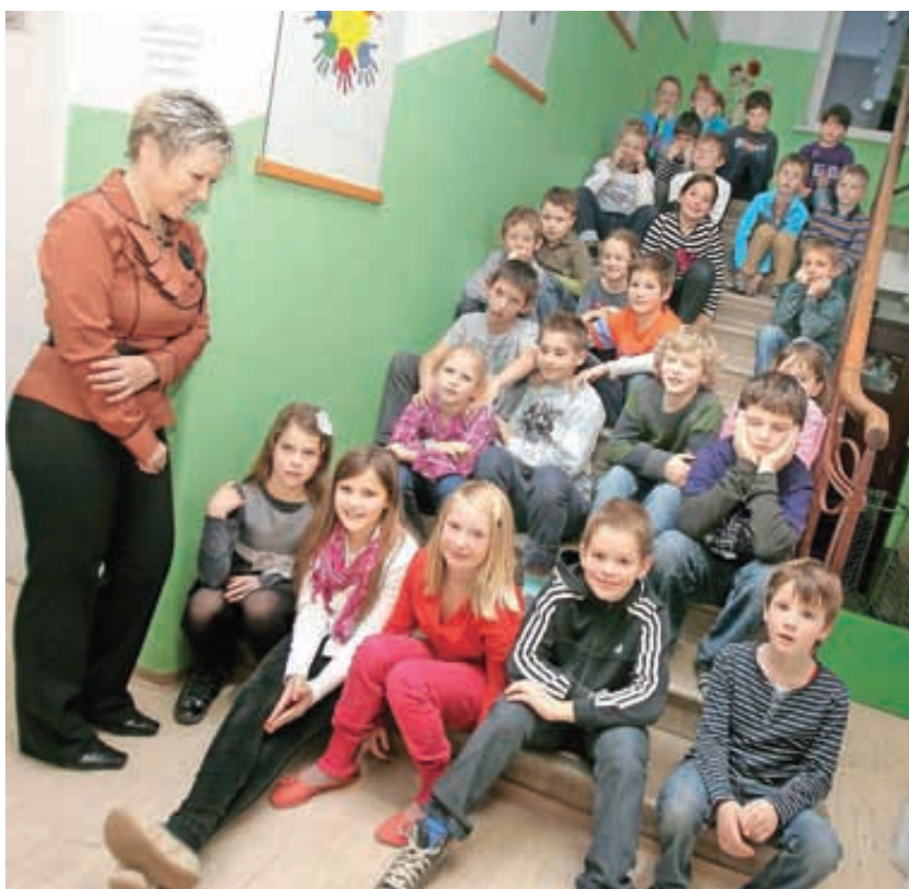
Šolo so s prenavo odeli v tople barve. / BESEDILO: SUZANA P. KOVAČIČ, FOTO: TINA DOKL