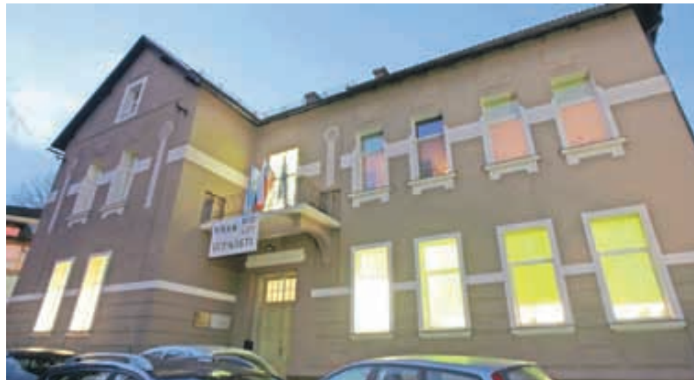
Nova fasada na Podružnični šoli Podbrezje