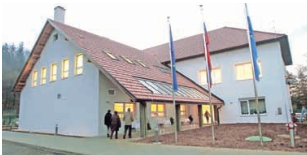
Zunanost šole v Dupljah z novim prizidkom