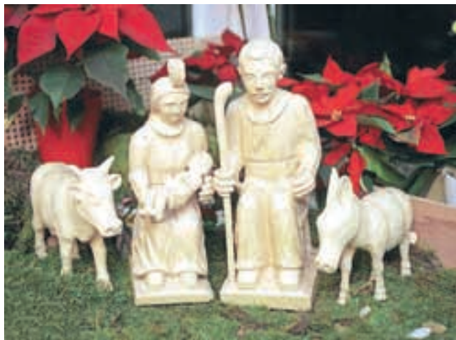
Čudovite lesene jaslice bodo rasile dom v Rimu.