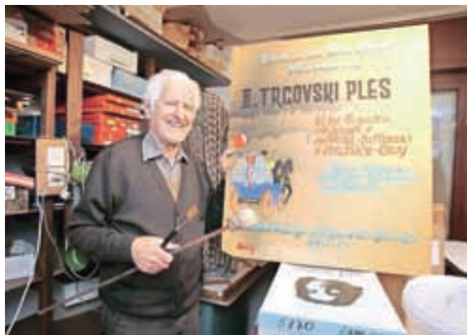
Plakat, ki vabi na ples in ga je izdelal Ivan Kunčič leta 1954.