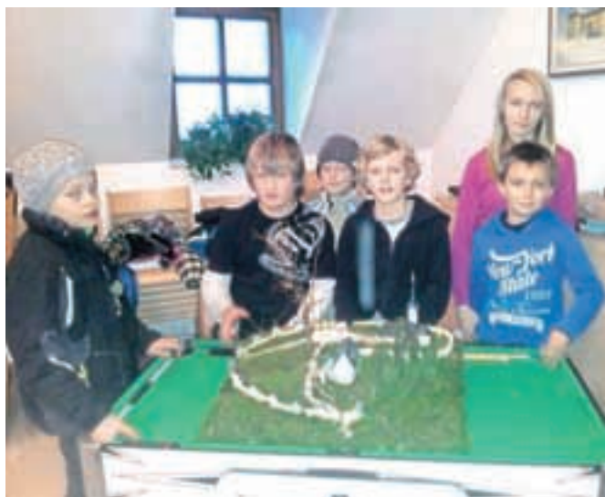
KUD Tabor je pripravilo predpraznično delavnico izdelovanja maket taborske cerkve ...