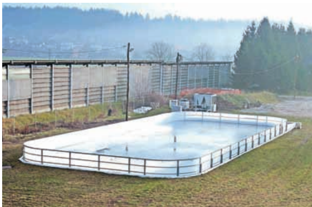
Za vzdrževanje, animacijo in prijetno vzdušje bo na drsališču v Naklem skrbelo podjetje Vita center. Fotografija je nastala še pred odprtjem drsališča.

otroke od četrtega leta starosti naprej. Cena tečaja bo 15 evrov na otroka, za vsakega dodatnega otroka iz ene družine bo tečaj stal evro manj. 11. januarja bo brezplačno hokejsko razigravanje za otroke in mladino do 14. leta starosti, 18. januarja bodo potekale igre brez meja prav tako brezplačno. Od 20. do 24. januarja bodo organizirali še en tečaj drsanja za otroke od četrtega leta starosti naprej. Program animacij za februar in marec bodo še sporočili.