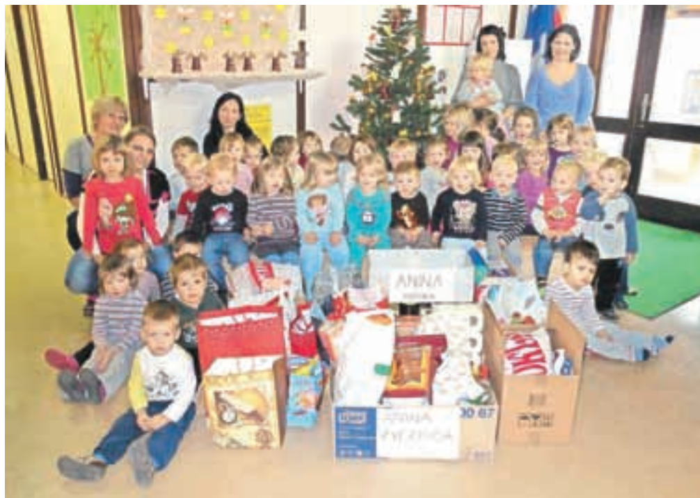
Z dobrodelno akcijo Anina zvezdica smo zbirali hrano in tako pomagali pomoči potrebnim.