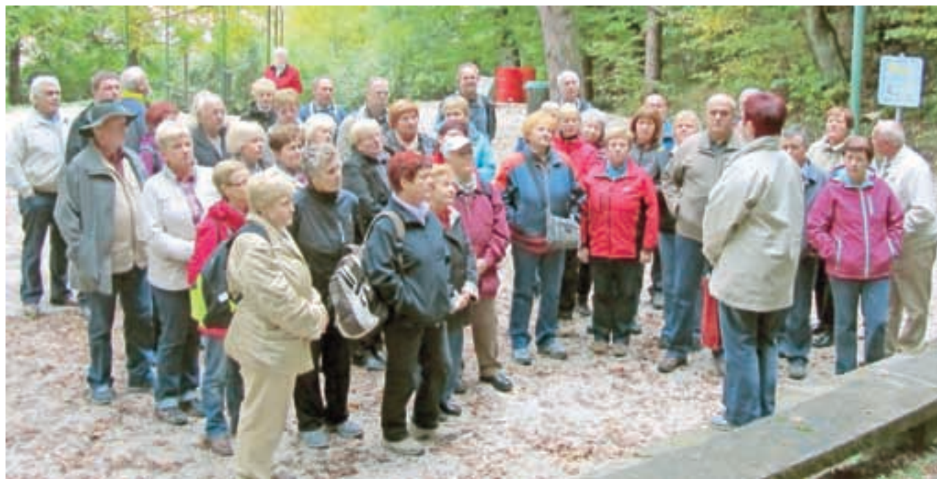
Izletniki v naravnem gledališču v Rušah