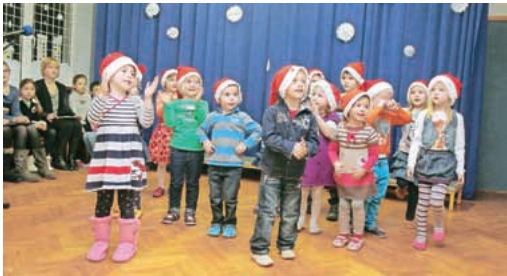
Nastopajoči najmlajši na slovesnosti v Dupljah

spevala EU, en del občinski proračun. Šola je dobila novo fasado, komplet novo centralno z ogrevanjem na pelete, izolirali smo podstreho, namestili nova svetila, preplekali vse stene,« je naštel podžupan Aleš Krumpetar in poudaril, da so rešili tudi problem z vodo, ki je ob obilnem deževju poplavljala klet: »Naredili smo drenažo in odvodnjavanje in mislim, da smo s tem rešili problem.«