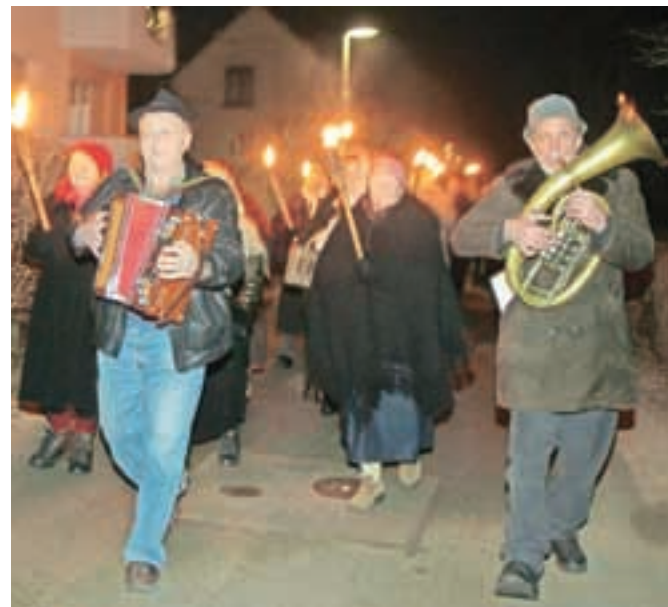
Koledniki Folklorne skupine Društva upokojencev Naklo so pred dnevi prišli na odprte Božično-novoletne razstave v Graščini Duplje.

V soboto, 4. januarja 2014, ob 19. uri vabljeni na 13. nočni pohod do Krive jelke v organizaciji Kulturno turističnega društva Pod Krivo jelko. Pohodnike bodo obiskali Sveti trije kralji, hkrati bo dogodek tudi zaključek koledovanja s člani Folklorne skupine Društva upokojencev Naklo.