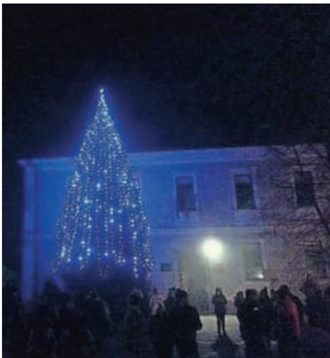
Konjensko društvo Naklo je organiziralo postavitve in blagoslov božičnega drevesca pred vrtcem Rožle.

Lučke so nekaj dni pred tem prižgali tudi pred vrtcem v Dupljah. Božično drevesce je letos dobilo novo lokacijo, s petjem in plesom pa so božično-novoletni duh priklicali otroci iz oddelkov tri, štiri in pet.