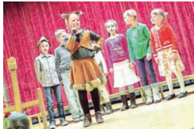
Prireditev so popestrile članice Otroške folklorne skupine Podkuca.