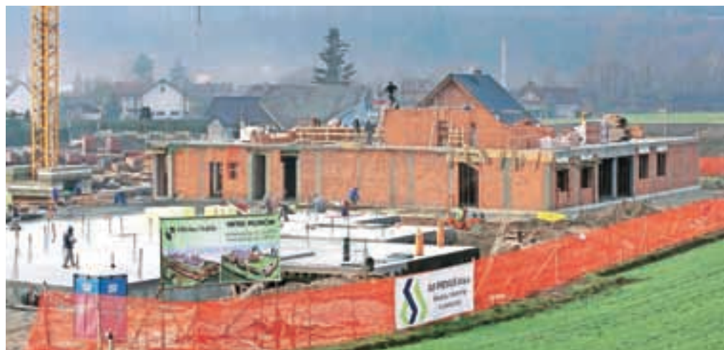
Gradnja vrtca Mlinček v Naklem

Obćinski svetniki so na zadnji letošnji seji občinskega sveta sprejeli Sklep o vrednosti toćke za izraćun nadomestila za uporabo zazidanega in nezazidanega stavbnega zemljišća (NUSZ) v občini Naklo za leto 2014. Na občinski upravi so pojasnili, da o davku na nepremičnine ni še vse povsem znano, zato je bilo treba za vsak slućaj sprejeti vrednost toćke za leto 2014. Ta bo za 1,9 odstotka višja kot letos, povišanje pa je revalorizirana vrednost toćke za leto 2013 z indeksom rasti življenjskih potrebšćin, kot ga je ugotovil republićki Statistićni urad za obdobje zadnjih dvanajstih mesecev.