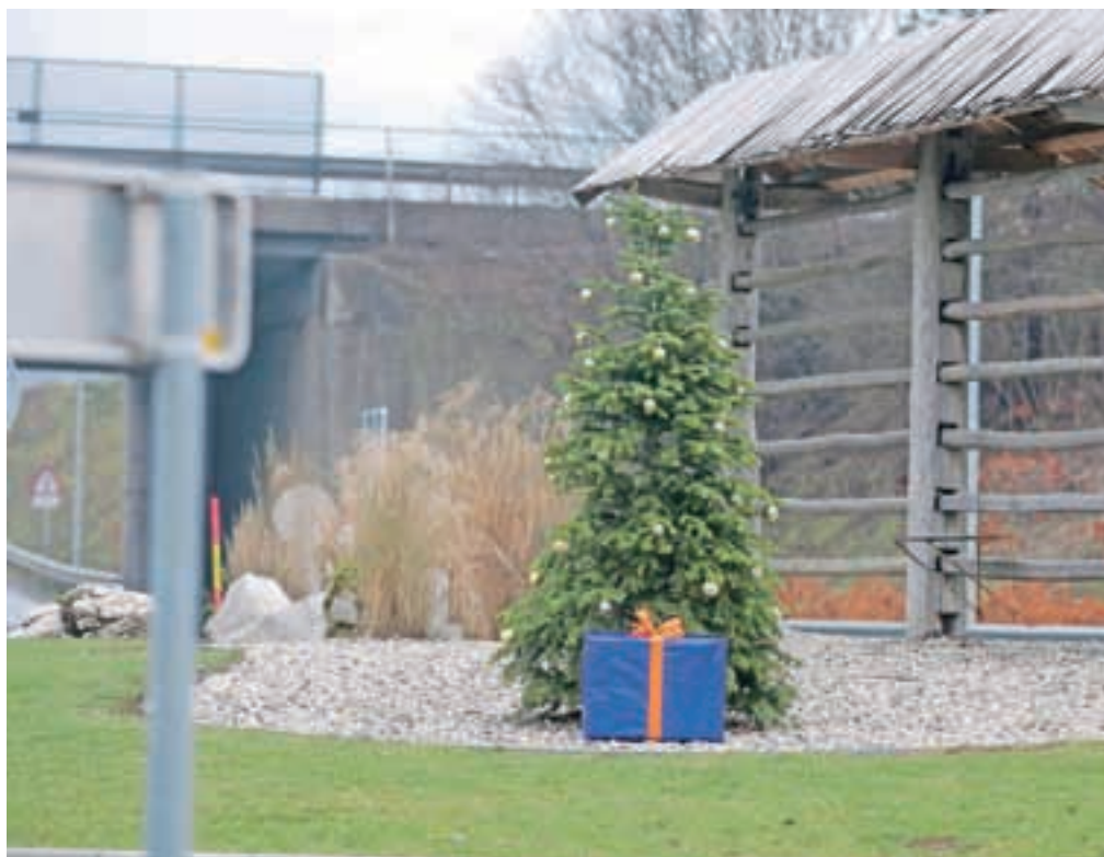
Novoletno drevesce v krožišču

Veliko ročnih spretnosti je zahtevala tudi delavnica o izdelovanju novoletnih voščilnic, namenjena podbreški mladini. Delavnico so obiskala predvsem dekleta, ki so s pomočjo izkušenih mentoric izdelala lične novoletne čestitke.